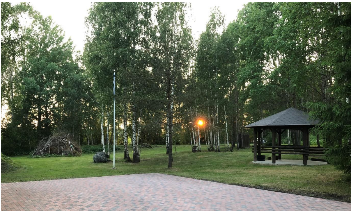
Suursoo Külaplats 2022.aasta

Vana-aasta õhtul veidi enne keskööd koguneb külarahvas külaplatsile, kus ilutulestiku saatel saab oma kuumat kalliga head uut aastat soovida. Siis võib taas sammud kodu poole seda tunde, et naabrite head soovid uude aastasse on tulnud südamest.