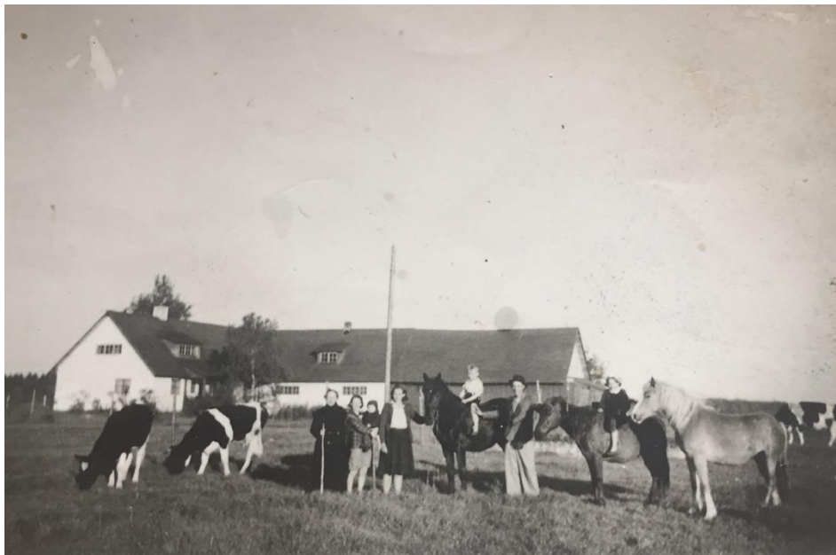
1932.aastal ehitatud Kiviaru talust foto (erakogu)

SUURSOO VALIMINE. 1934. aastal 15. augustil käis külas riigivanem Konstantin Päts, kes vaatas tehtud tööd ise üle.