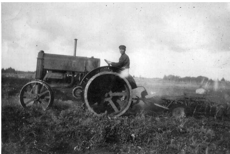
Esimene traktor Suursoo külas

1930 aasta kevadel alustati asunduses ka sisemise teevõrgu loomisega ja selle ühendamiselega Pikavere- Aruvalla maanteega. 1931 aastal ehitatud teega loodi otseühendus Aruküla jaama ja Jüri- Raasiku maanteega. Üle soo viis Tallinnasse talitee. Seda kasutati hoolega.